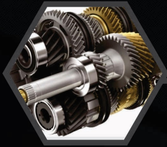
FABRICACIÓN DE ENGRANES