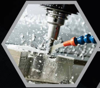
MAQUILA DE TORNO Y FRESADORA

FABRICACIÓN DE PIEZAS SOBRE MEDIDA, DESDE UNA PIEZA HASTA GRANDES VOLÚMENES