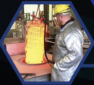
TRATAMIENTO TÉRMICO Y TEMPLADO