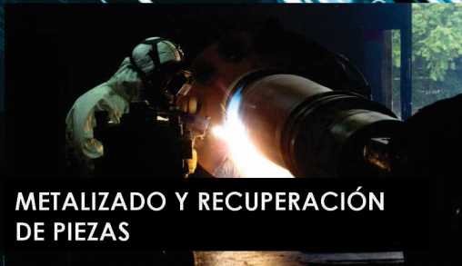
METALIZADO Y RECUPERACIÓN DE PIEZAS