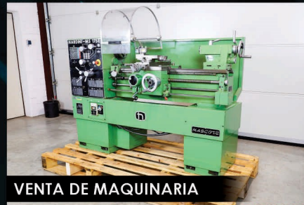
VENTA DE MAQUINARIA