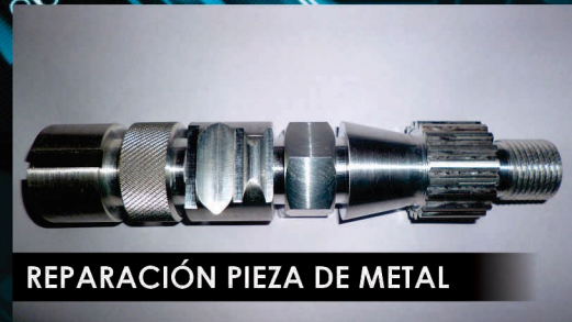
REPARACIÓN PIEZA DE METAL