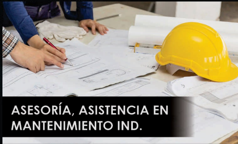
ASESORÍA, ASISTENCIA EN MANTENIMIENTO IND.